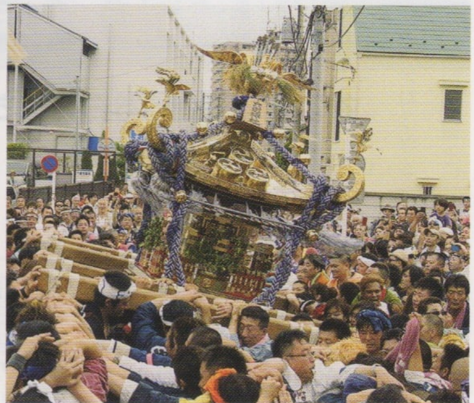
宮入り前の式之神輿