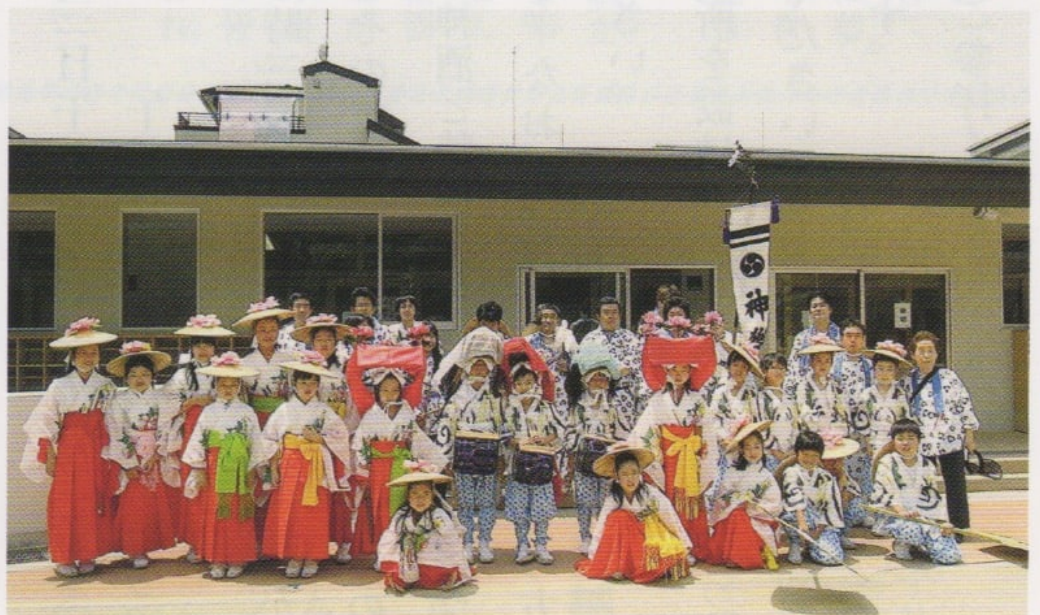
子供神獅子舞の舞子と世話人一同