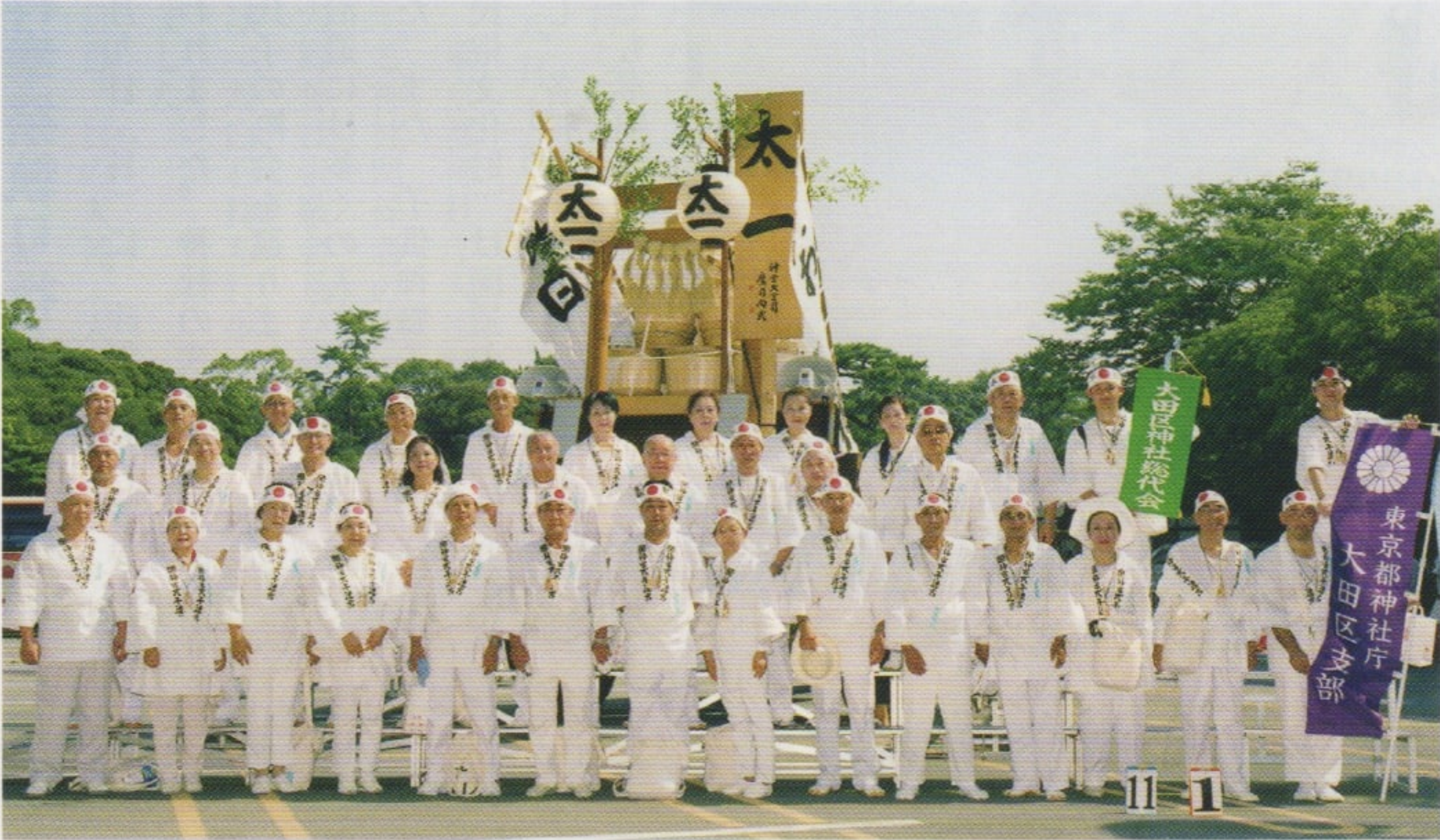
神宮式年遷宮「お白石持ち行事」奉獻参拝者