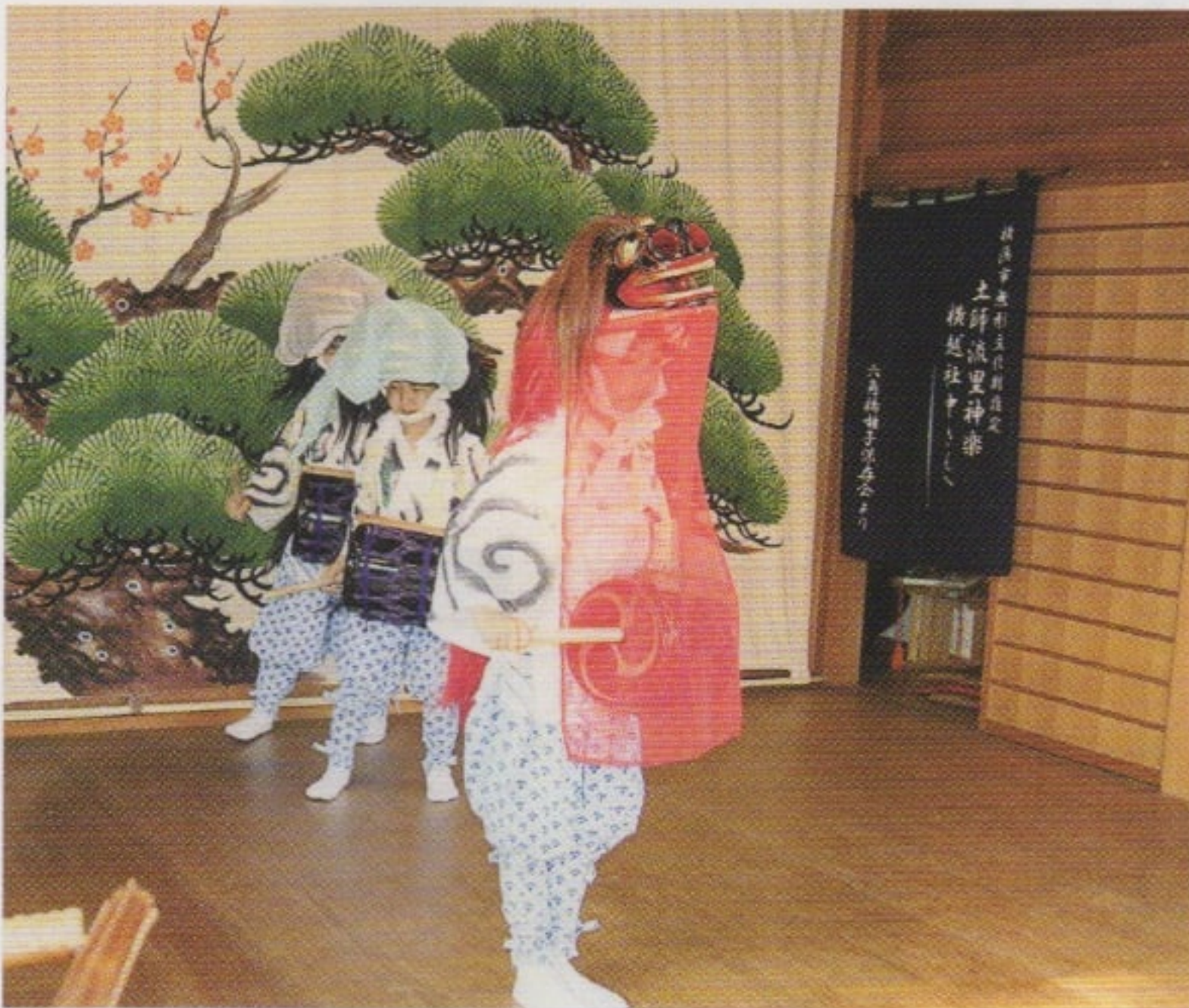
神楽殿で演舞する子供神獅子舞