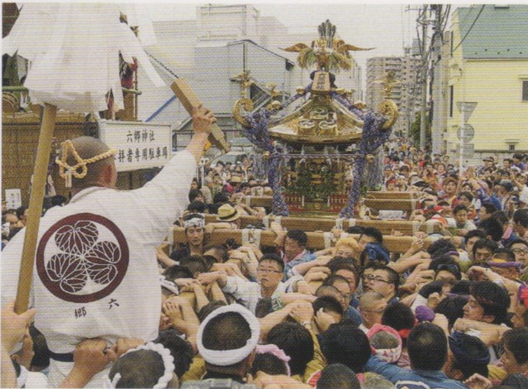
氏子町会を巡行する式之神輿

六月九日（日）に、昨年につきご神幸祭が行われました。神社の式之神輿が国道西側の氏子の町会を巡りました。好天に恵まれ、沿道には多くの人々が集まり、賑わいました。また、子供神獅子舞（大田区指定無形民俗文化財）は国道の東側の町会を道行きし、各神酒所で演舞するとともに、神楽殿でも奉納演舞しました。