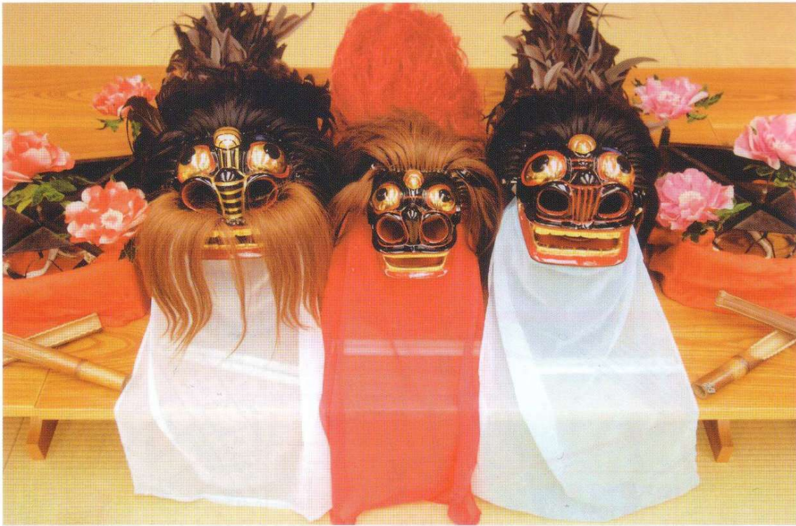
補修完成した獅子頭 左から お 牡獅子、 め 牝獅子、 なか 中獅子