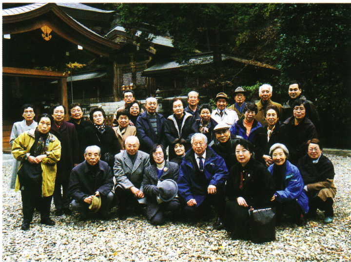
12月7日（土）午前7時20分出發。参加者