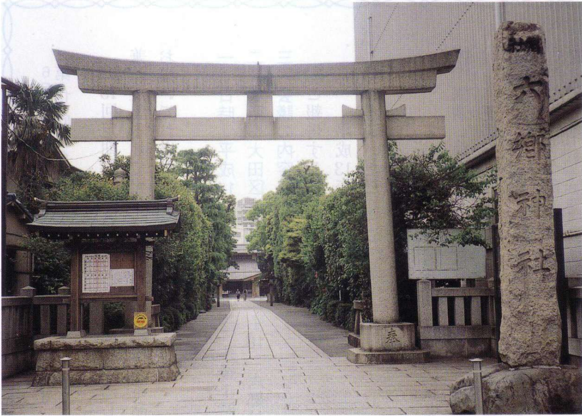
六郷神社の脇参道—新緑が美しい—