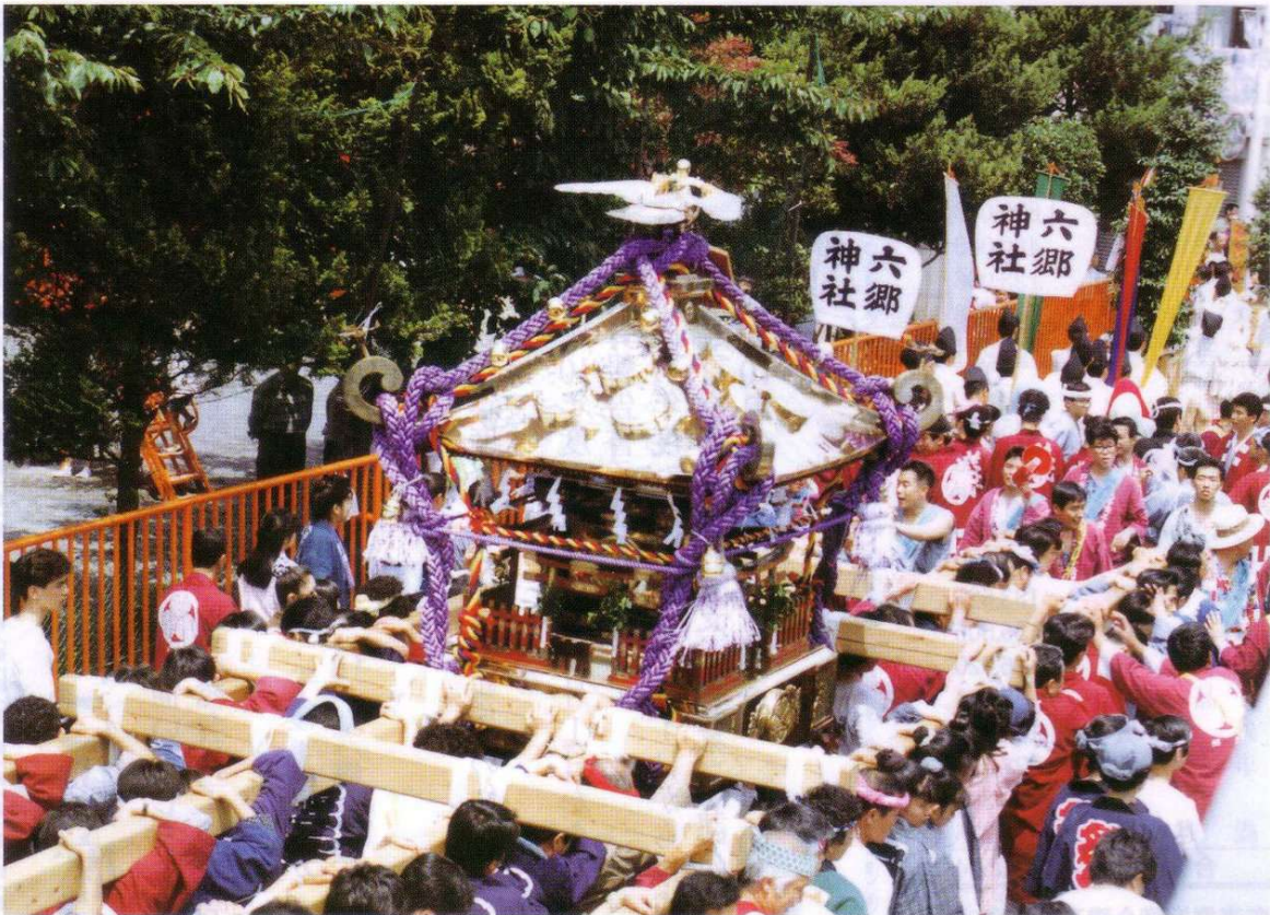
一之神輿の渡御 (平成2年6月3日撮影)